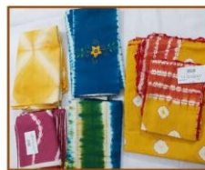
টেবিল ক্লথ সেট