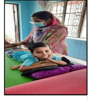
সহায়ক উপকরণ প্রদান