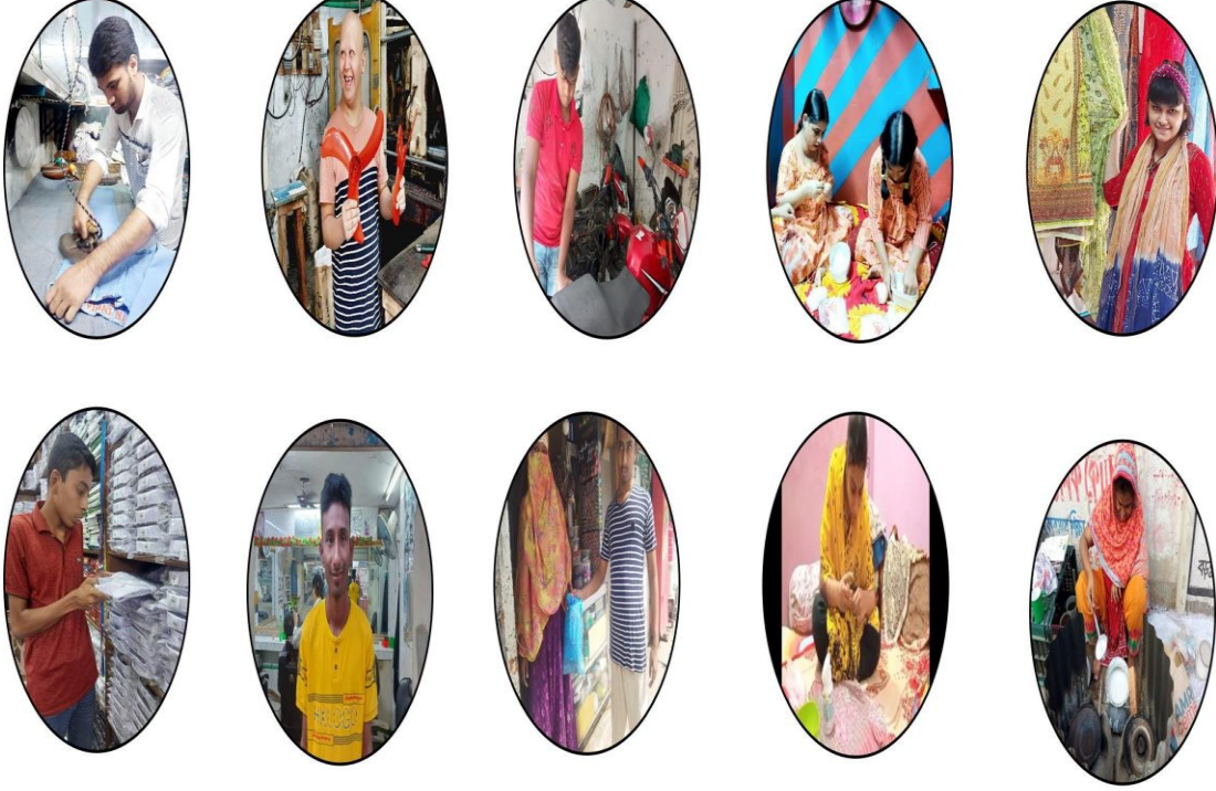
চিত্র: বিভিন্ন প্রশিক্ষণে নিযুক্ত প্রশিক্ষণার্থীরা