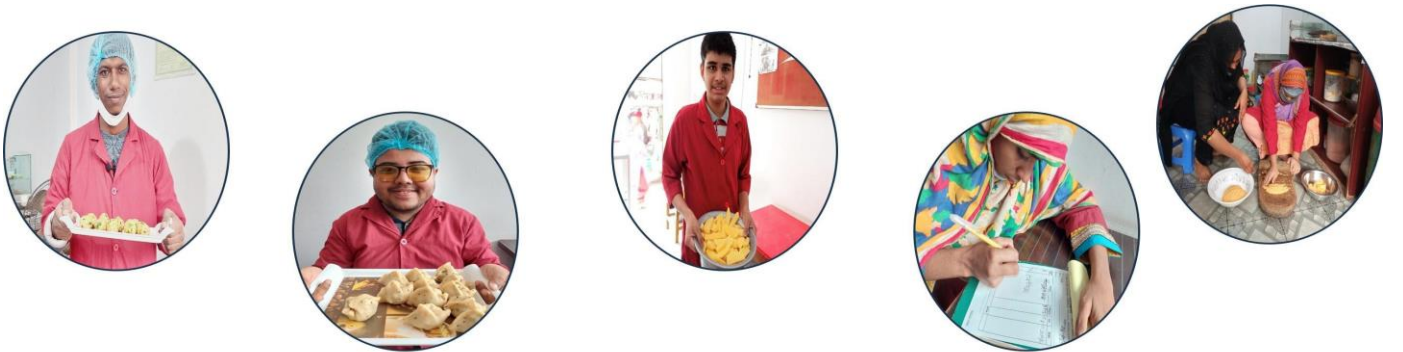
চিত্র: ‘সীড রান্নাঘর’ এর প্রশিক্ষণার্থীরা