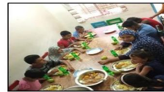
চিত্র: স্কুল রেডিনেস ও বৃত্তিমূলক প্রশিক্ষণ