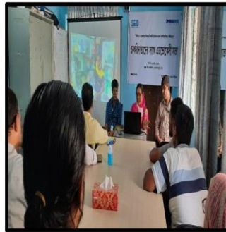
চাকরিতাদের সাথে সভা