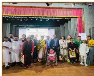
হারনেট টিভি প্রোগ্রাম

৩. 'হারনেট ফাউন্ডেশন' কর্তৃক আয়োজিত 'Bangladesh Decides: The Youth Speaks' নামক প্রোগ্রামে সীড এর শিক্ষার্থীরা জাতীয় সঙ্গীত পরিবেশন করেছে। পাশাপাশি উক্ত প্রোগ্রামে সীড এর কার্যক্রমভিত্তিক ভিডিও প্রদর্শিত হয়েছে।